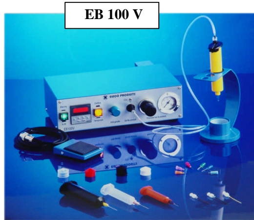
EB 100 V

Pour les applications industrielles, on dépose VITRALIT de manière fiable et précise grâce à nos accessoires anti-UV. La distribution peut être semi automatique par point ou cordon. Nos équipements sont modulables et peuvent s'intégrer sur chaînes (robots, tables xyz,...)